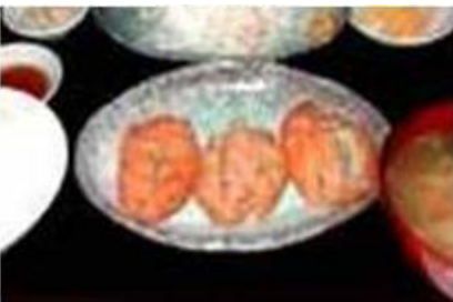
とんかつセット Tonkatsu Set

天ぷらセット TEMPURA SET P 280 ASSORTED DEEP FRIED SEAFOODS AND VEGETABLES, RICE & MISO SOUP, etc.