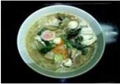
五目塩ラーメン Gomoku Shio Ra-men