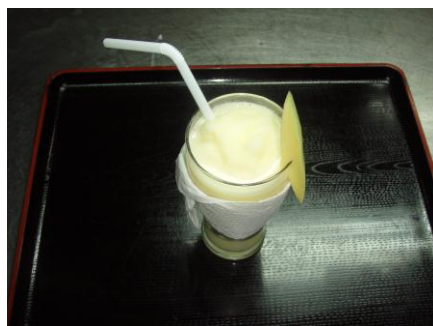
グリーンマンゴーシェイク Green mango shake