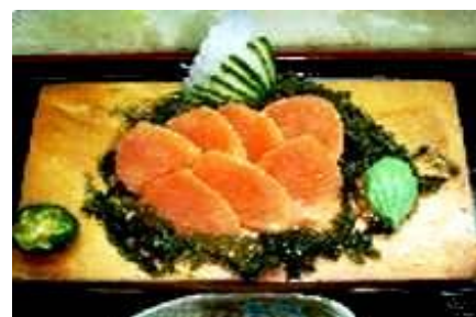
鮭 SAKE (Salmon)