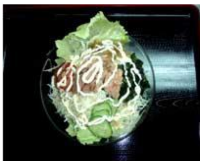
ツナサラダ TUNA SALAD