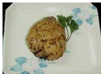
焼きおにぎり (1個) Yaki Onigiri