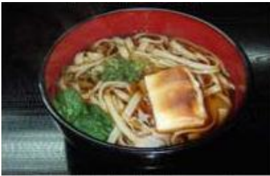
ちからうどん Chikara Udon