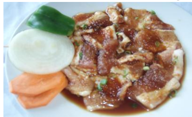
ポーク カルビ Pork Karubi