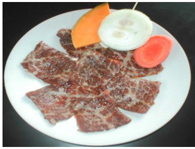
上 カルビ Jo Karubi