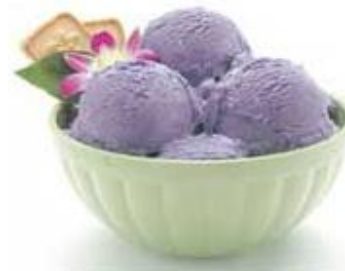
Ube Ice Cream