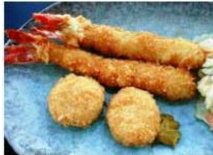
海老ホタテフライセット Ebi Hotate Fry Set

野菜天ぷらセット YASAI TEMPURA SET P 240 ASSORTED DEEP FRIED 5 KIND VEGETABLES, RICE & MISO SOUP, etc.