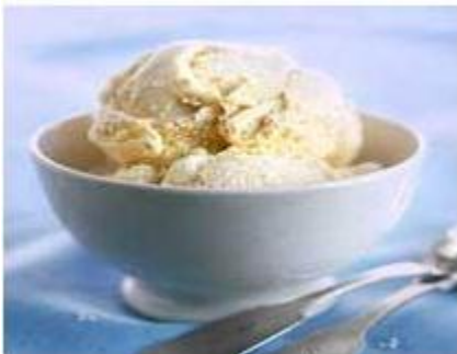
Vanilla Ice Cream