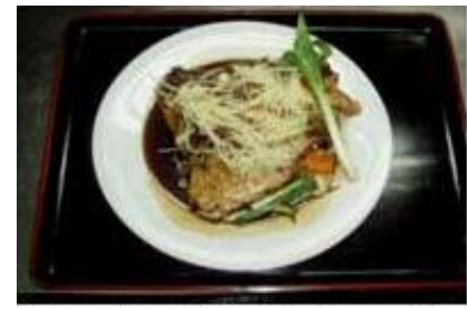
鯛カブト煮 Tai Kabuto Ni