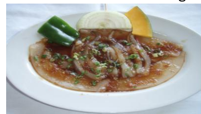
イカ Marinated Squid