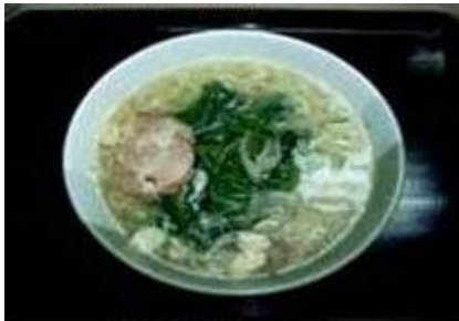
青菜塩ラーメン Aona Shio Ra-men