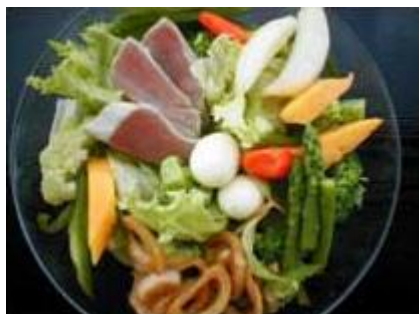
はんにゃサラダ Han-Nya Salad