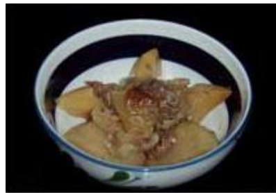
肉じゃが Nikujaga (Beef & Potato)