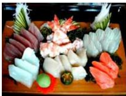
6種盛り大(3-4名) Rokushu Mori Dai