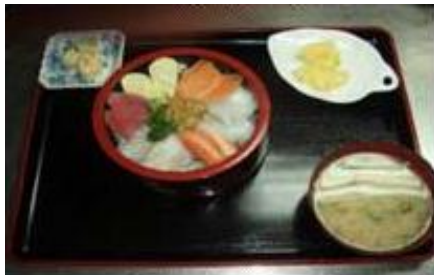
ちらし寿司セット Chirashi Zushi Set