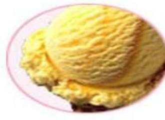
Mango Ice Cream