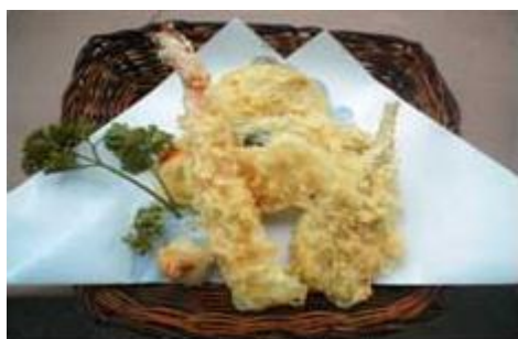
天ぷら盛り合わせ TEMPURA MORIAWASE