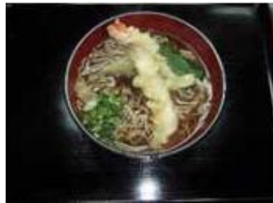
天ぷらそば Tempura Soba