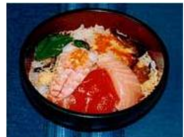
ちらし寿司 Chirashi Sushi