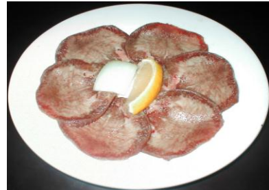
上 タン塩 Jo Tanshio