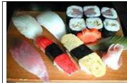
寿司セット Sushi Set

チキン鉄板焼きセット CHICKEN TEPPANYAKI SET P 250 CHICKEN TEPPANYAKI, RICE & MISO SOUP, etc.