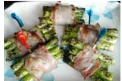
アスパラ ベーコン巻き Asparagus bacon Maki