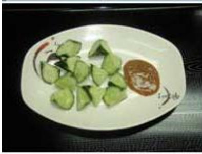
モロキュウ Morokyuu (Cucumber/ Special Miso)