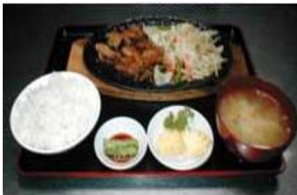
チキン鉄板焼きセット Chicken Teppanyaki Set