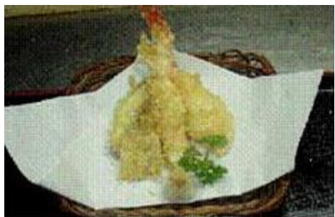
エビ天ぷら Ebi Tempura