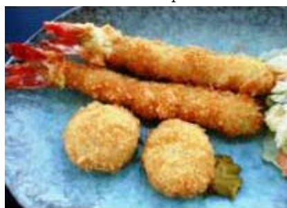
海老ホタテフライ EBI HOTATE FLY