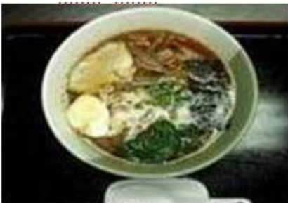
赤鬼醤油ラーメン Akaoni Shouyu Ra-men