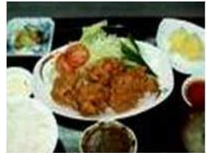
若鶏唐揚げセット Wakadori Karaage Set

海老ホタテフライセット EBI HOTATE FRY SET P 420 DEEP FRIED BREADED PRAWNS, SCALLOP, RICE & MISO SOUP, etc.