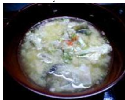
あら汁 ARA JIRU (Fish Head Miso Soup)