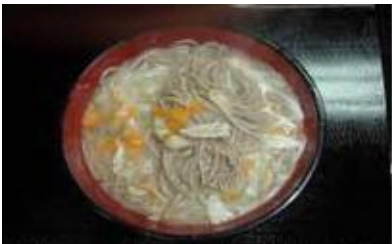
冷やし又はホット豚汁そば Tonziru Soba