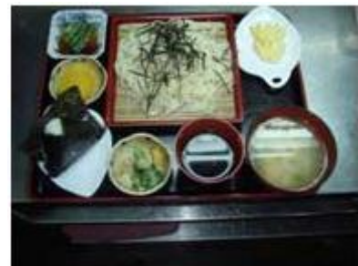
ざるうどん おにぎりセット ZARUUDON ONIGIRI SET

鉄火巻き 茶そばセット TEKKAMAKI CHASOBA SET P 320 TEKKA MAKI & COLD GREEN TEA NOODLES, etc.