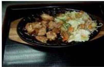
チキン鉄板焼き Chicken teppanyaki