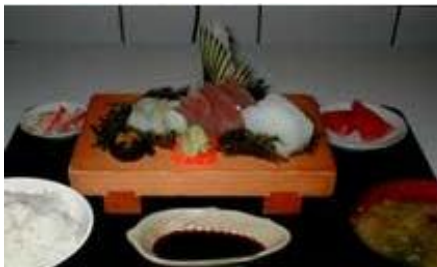
刺身セット Sashimi Set