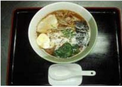
醤油ラーメン Shoyu Ra-Men