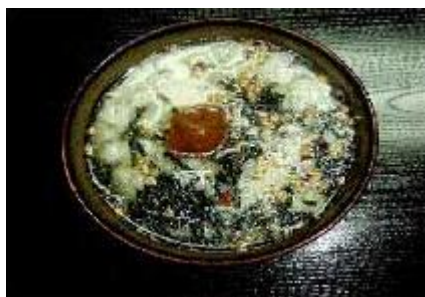
梅茶漬け Ume Chazuke