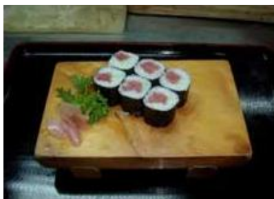
鉄火巻き Tekka Maki (Tuna)