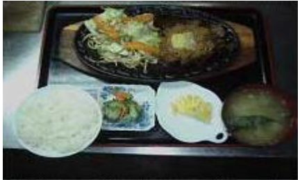
ビーフヒレ鉄板焼きセット Beef Hire Teppanyaki Set