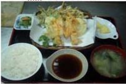
野菜天ぷらセット Yasai Tempura Set