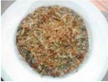
おこのみ焼き Okonomi Yaki