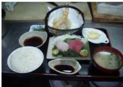
刺身, 天ぷらセット SASHIMI, TEMPURA SET

刺身, 天ぷらセット SASHIMI, TEMPURA SET P 330 SASHIMI (TUNA & TAI), TEMPURA (PRAWN & KISU FISH), RICE & MISO SOUP, etc