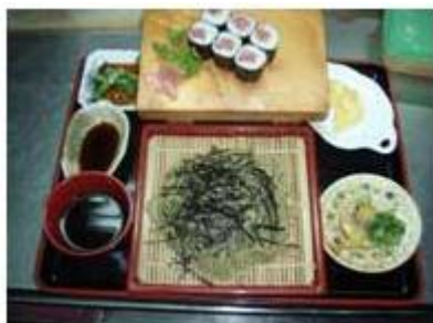
鉄火巻き 茶そばセット TEKKAMAKI CHASOBA SET

三色巻きセット SANSHOKU MAKI SET P 550 TEKKA MAKI, CALIFORNIA MAKI, UNAGI MAKI, & MISO SOUP, etc.