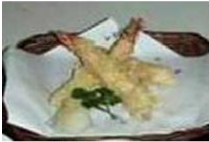
エビ天ぷらセット Ebi Tempura Set