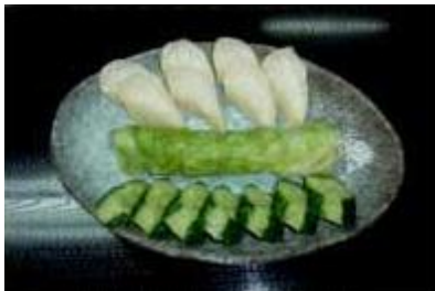
お新香盛り合わせ Oshinkou Moriawase