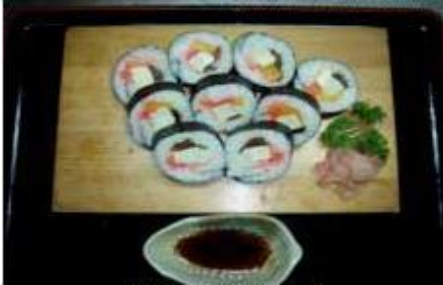
太巻き (9 かん) Futomaki 9 Pieces