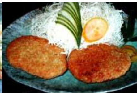
メンチカツ MENCHI KATSU