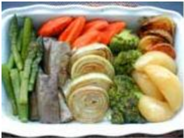
カレー掛けグリルド ヴェジタブル Grilled Vegetables w/Curry