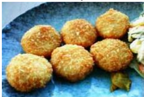
ホタテフライ HOTATE FRY