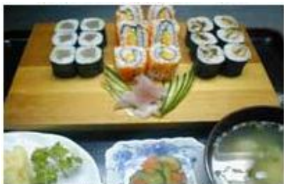
三色巻きセット SANSHOKU MAKI SET

刺身, 天ぷらセット SASHIMI, TEMPURA SET P 330 SASHIMI (TUNA & TAI), TEMPURA (PRAWN & KISU FISH), RICE & MISO SOUP, etc