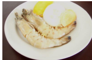
車エビ塩焼き 2匹 Prawn(2pcs≒100g)