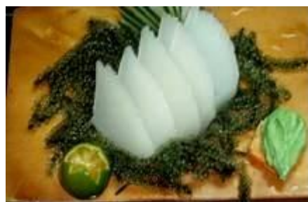
いか(当店推薦) IKA (Squid)