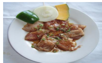
太ももチキン(骨なし) Chicken Boneless Thigh