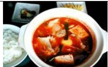
コチュジャン鍋セット kochujan Nabe Set

寿司セット SUSHI SET P 320 ASSORTED SUSHI (11 PIECES) & MISO SOUP, etc.