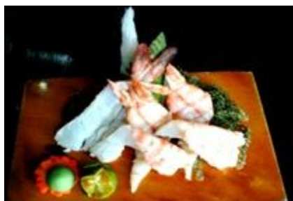
海老(瞬間湯通し) EBI (Prawn)