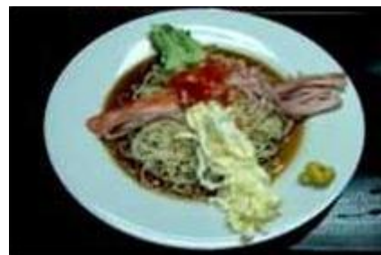
冷やし中華 Hiyashi Chuka