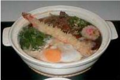
鍋焼きうどん Nabeyaki Udon