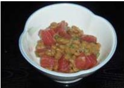
マグロ納豆 Maguro Nattou