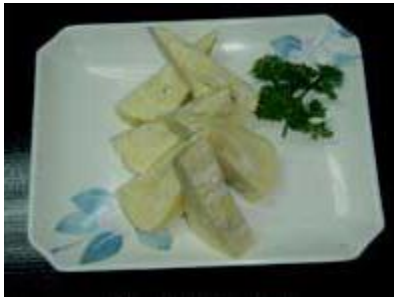
ダシ巻き玉子 Dashimaki Tamago