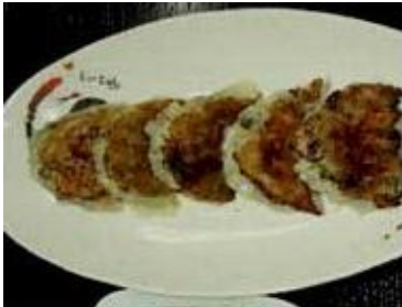
餃子 (5 個) Gyouza 5 piece s