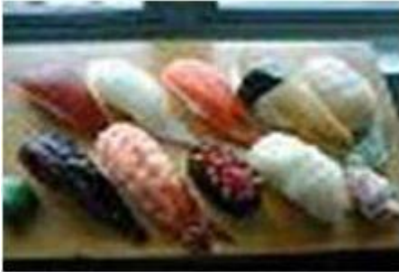
特上にぎり Tokujoh Nigiri