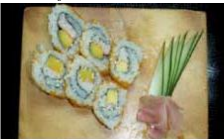
カリフォルニア巻き California Maki