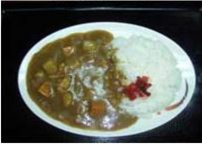
チキンカレーライス Chicken Curry Rice