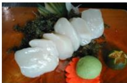
ホタテ貝 HOTATE GAI (Japanese Big Scallop)

上6種盛り(3-4名) JOU ROKUSHU MORI (6Kinds 3-4 PERSONS) P 1200