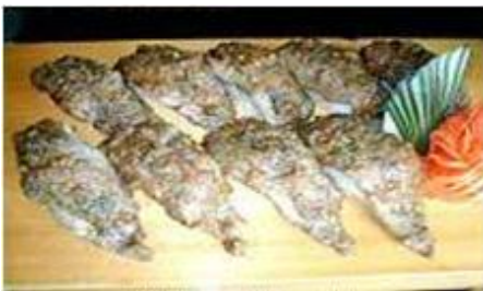
上ビーフカルビ Jo Beef Karubi