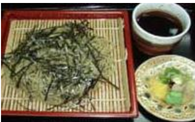
ざるそば Zaru Soba