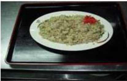
チャーハン&スープ Cha-han Fried Rice