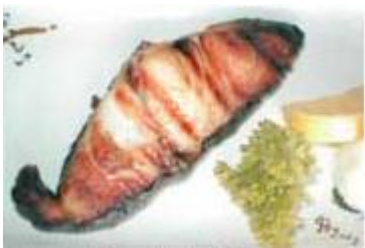
銀だら塩焼き Gindara Shio Yaki