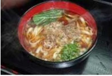
肉うどん Niku Udon