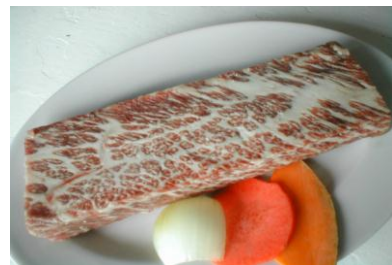
上 カルビステーキ Jo Karubi Steak(≒200g)