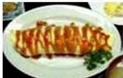
オムライス セット OMU RICE SET

鉄火巻き 茶そばセット TEKKAMAKI CHASOBA SET P 320 TEKKA MAKI & COLD GREEN TEA NOODLES, etc.