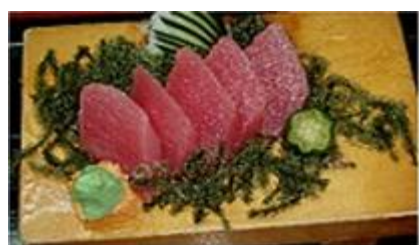
まぐろ MAGURO (Tuna)