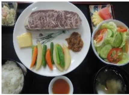
ビーフステーキセット BEEF STEAK SET