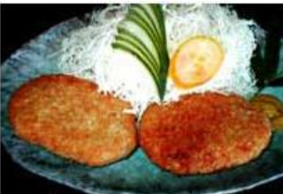
メンチかつセット Menchi Katsu Set