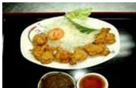
若鶏唐揚げ WAKADORI KARAAGE