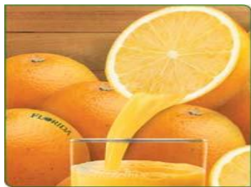
オレンジ ジュース Orange Juice