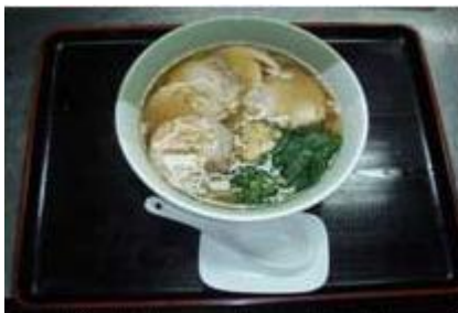
醤油チャーシューメン Shouyu Cha-Shu-Men