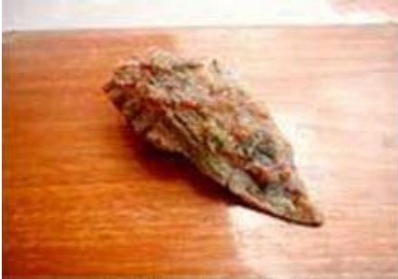
上ビーフカルビ Jo Beef Karubi